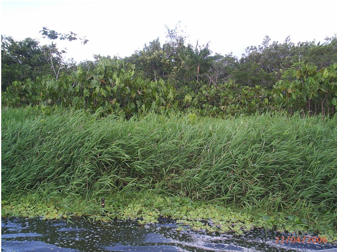
Punto de pesca frente al río Pichira