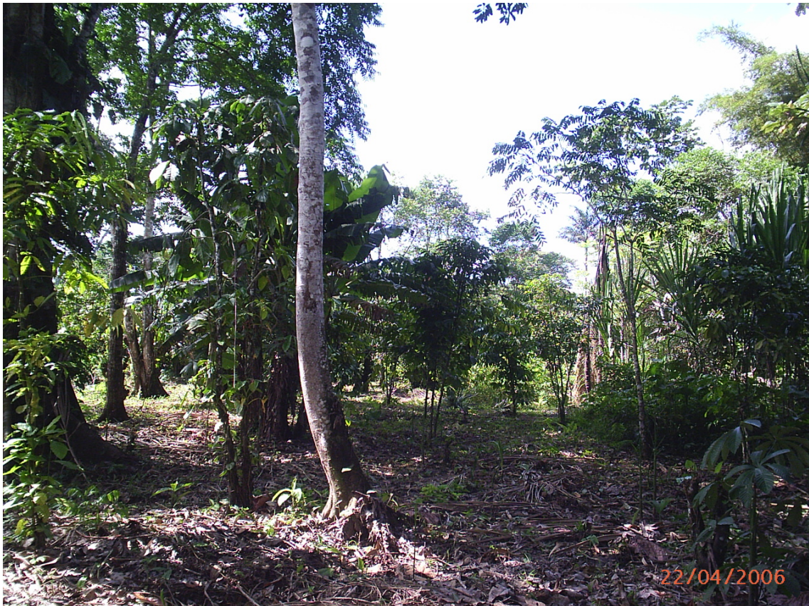
Cultivos varios dentro de la RBL