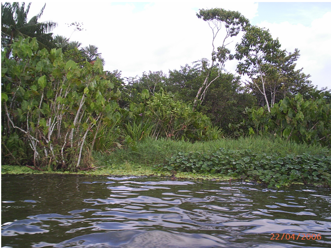
Punto de pesca frente al río Playayacu