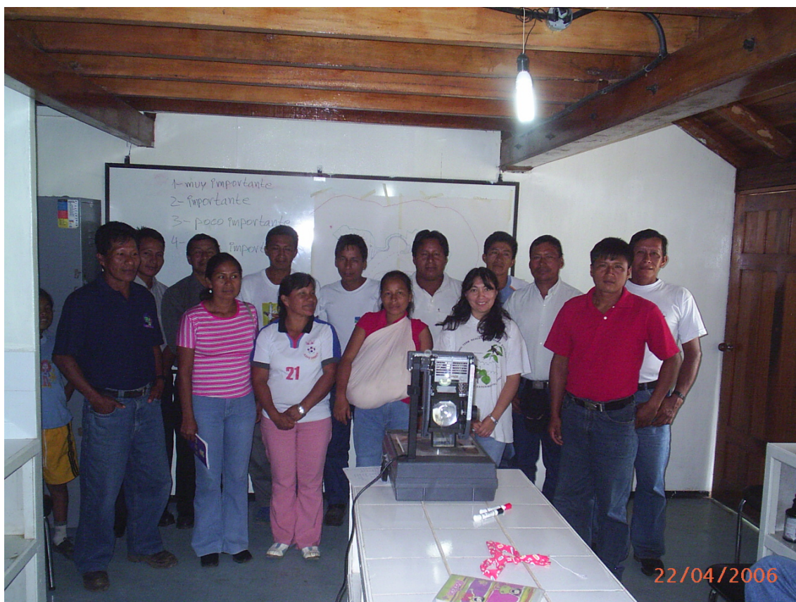
Asistentes al Taller