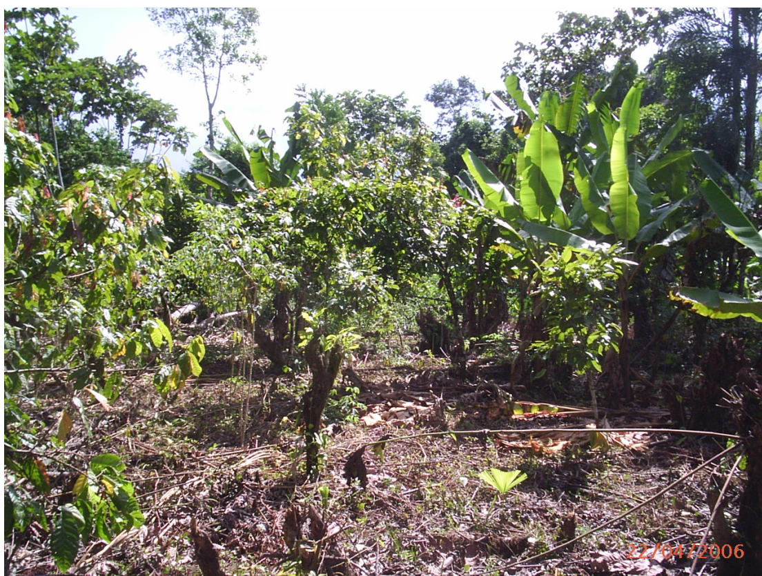
Cultivos Varios dentro de la RBL