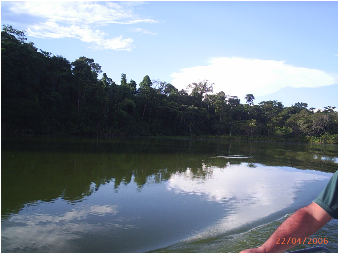
Punto de pesca desembocadura del río Pichira