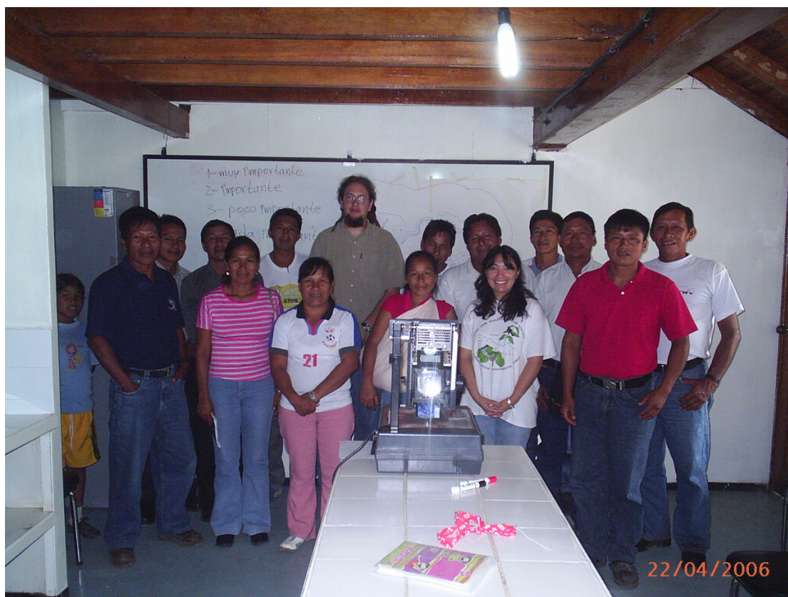
Asistentes al Taller