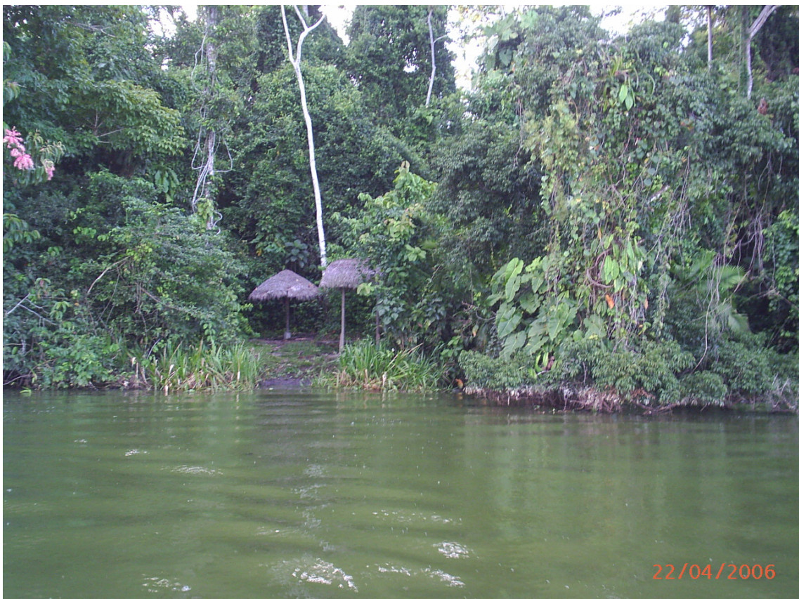
Punto de pesca y cacería Sendero El Caimán