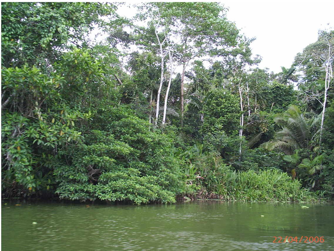
Punto de pesca Santa Elena