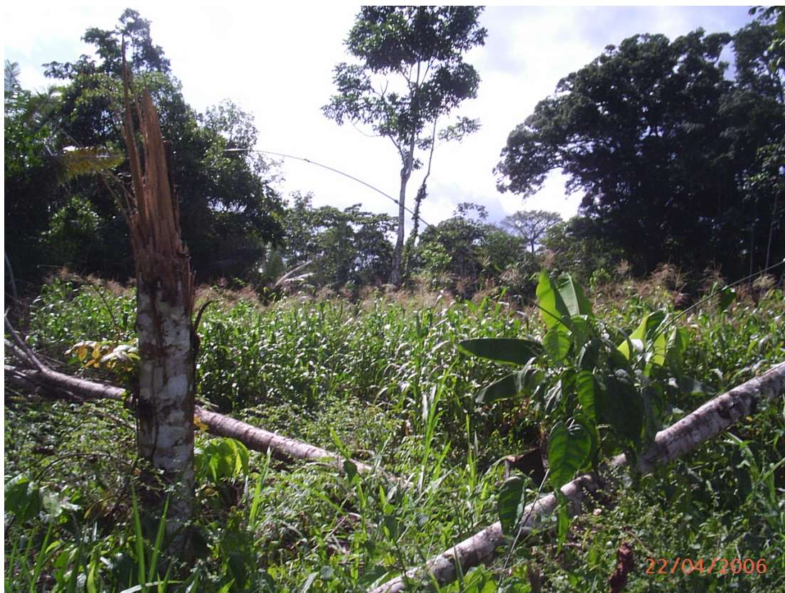
Cultivos de maíz dentro de la RBL