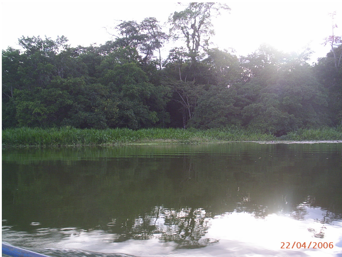
Punto de pesca desembocadura del río Playayacu

Nota: las fechas presentadas en las fotografías no corresponden a la fecha en las que fueron tomadas. Todas las fotos fueron tomadas el 21 de mayo de 2006 (21 / 05 / 2006).